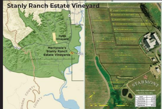
Stanly Ranch Estate Vineyard

1997年にミシェル・ロラン、ボブ・レヴィ（当時、メリーヴェールの醸造ディレクター）デイヴィッド・エイブリューの管理下で畑を一から作り直し改植した。現在約10haを所有。セント・ヘレナの東側の尾根、標高300m、フォグラインの上に位置しナパ・ヴァレーを一望に見渡す畑。急峻な斜面に位置し、岩がちで、農作業は非常に困難。土壌はシルト、砂、砂利などの複合砂質ロームなどモザイク状に入り組んでいる。多様な土壌やマイクロクリマが入り組んだ土地ゆえに、小さなブロックに区画分けして個々に管理している。