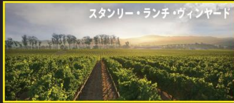
スタンリー・ランチ・ヴィンヤード