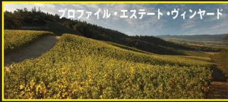
プロフィール・エステート・ヴィンヤード