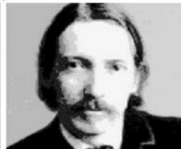
Robert Louis Stevenson